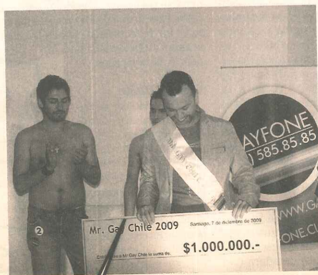
Un palo por dos horas no está mal.

aunque sí sus largas piernas que de vez en cuando rozan las mías. Sí, ando caliente, pero es el clima o la falta de vitamina C. Quizá por eso le cuento que el año pasado fui jurado junto a MEO y que fue muy chistoso todo.