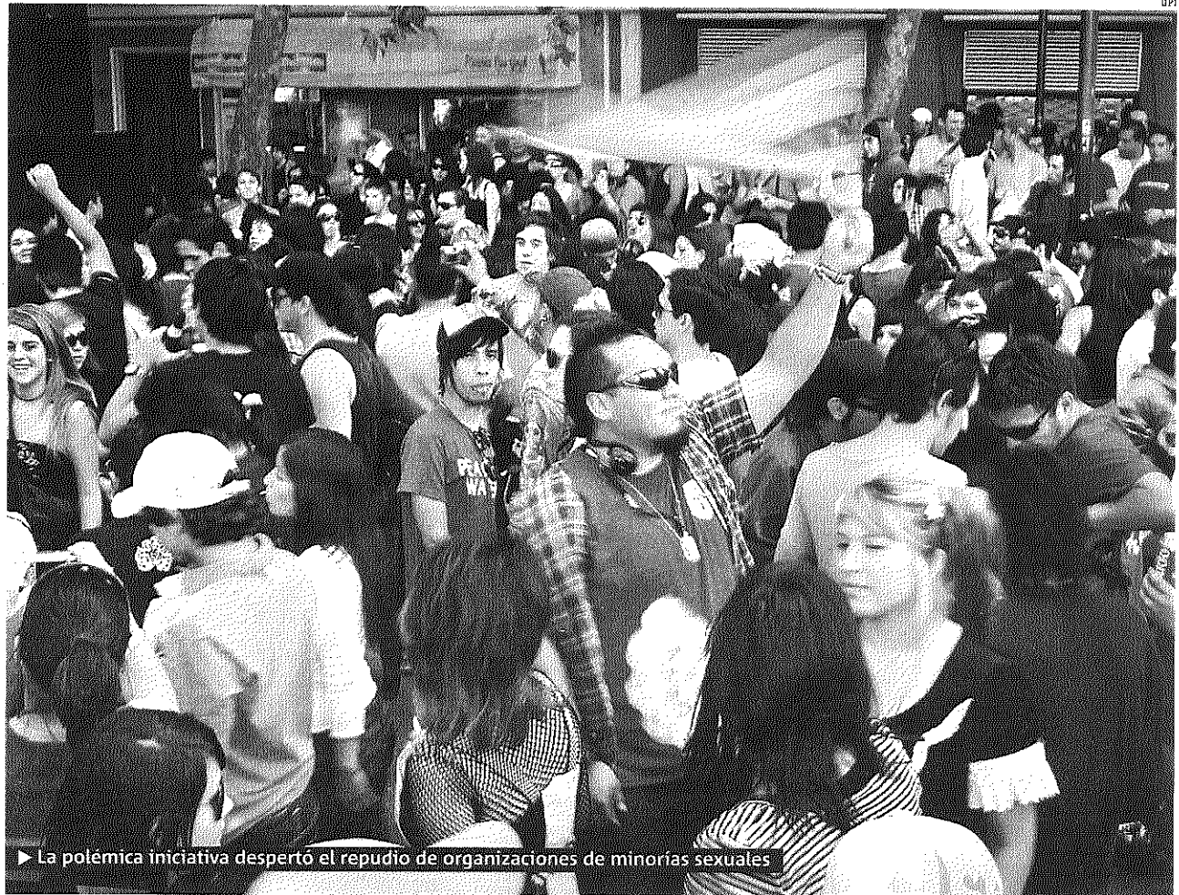
► La polémica iniciativa despertó el repudio de organizaciones de minorías sexuales

1 DIPUTADO PPD QUE SE RETIRÓ DE LA INICIATIVA