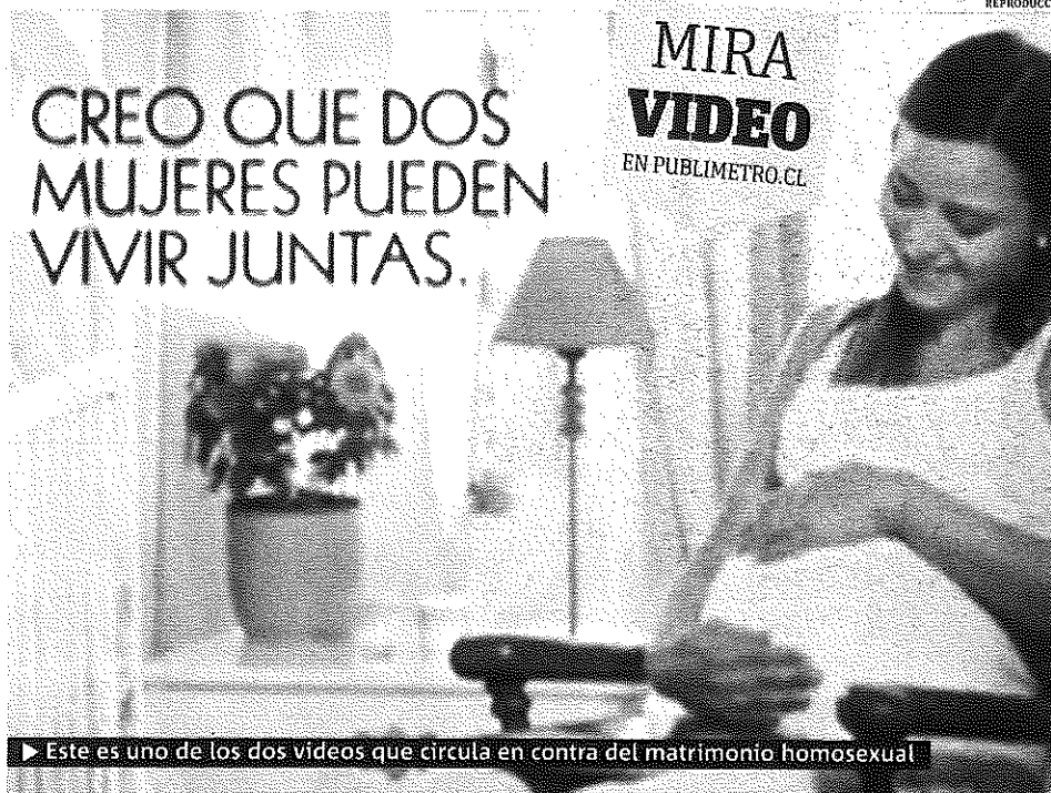
► Este es uno de los dos videos que circula en contra del matrimonio homosexual

Según el movimiento, la idea es realizar una vigilia frente a la entidad mientras se realiza la discusión y legalidad de este tipo de uniones. ●J.A.M