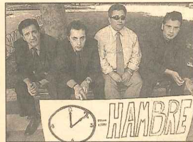
Garzones de Las Condes protestaron antes de que se anunciara la extensión horaria.