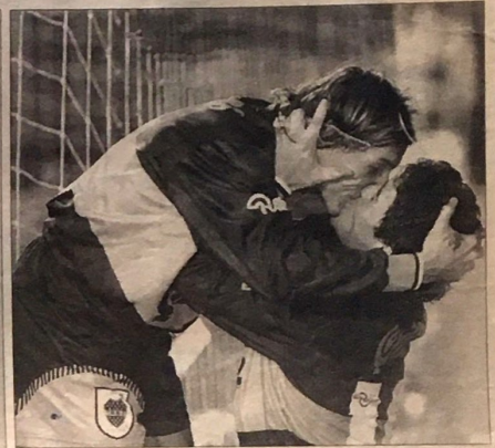
Besos en una cancha de fútbol: la emoción es más fuerte.

-Nunca vi, pero deben haber como en todas partes. Se dice que hay periodistas gays también y que están bien a la vista.