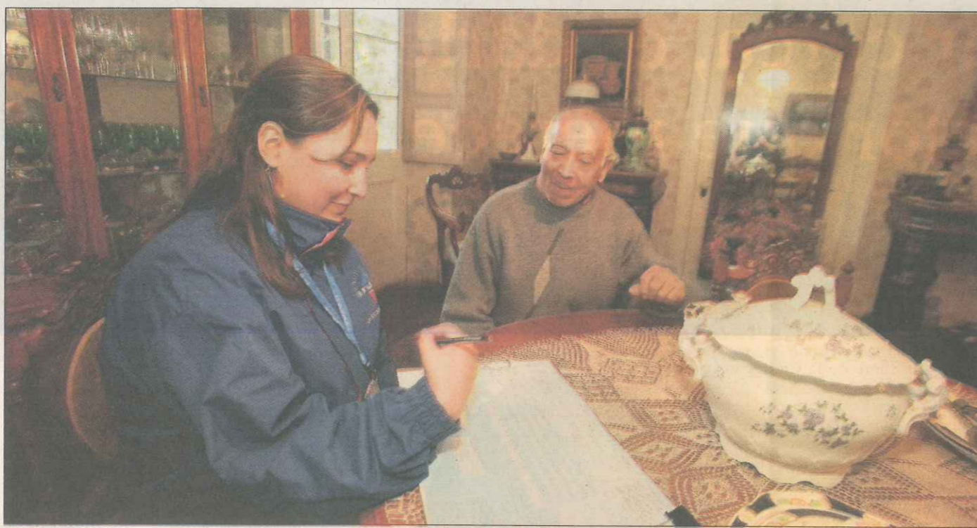
PRUEBAS.— El cuestionario que se realizará el próximo año ha sido sometido a varias pruebas, incluidas encuestas en 300 hogares urbanos y rurales.

Medirá desde la capacidad para utilizar la tecnología, el reciclaje de basura y cuánto nos demoramos al trabajo hasta la convivencia entre parejas del mismo sexo.