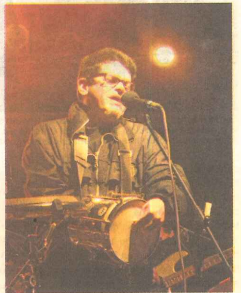
Joe Vasconcellos Músico

¿Post natal de seis meses?, la verdad es que no me he interiorizado mucho, pero ya habrá tiempo para solucionar los otros temas.