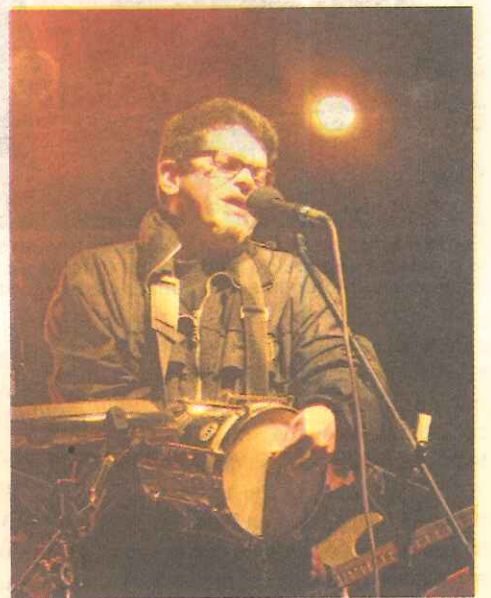
Joe Vasconcellos Músico

¿Post natal de seis meses?, la verdad es que no me he interiorizado mucho, pero ya habrá tiempo para solucionar los otros temas.