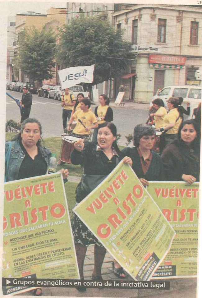
► Grupos evangélicos en contra de la iniciativa legal