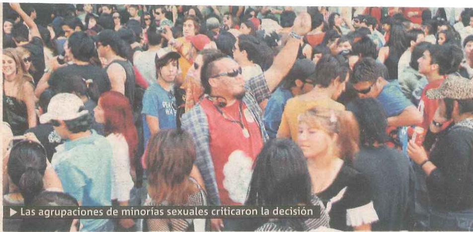
► Las agrupaciones de minorías sexuales criticaron la decisión