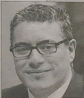
Becerra rescató que se planteara la temática gay.

En Sidacción lo encontraron "poco creíble" y criticaron que "con las relaciones entre los heterosexuales hay manga ancha".