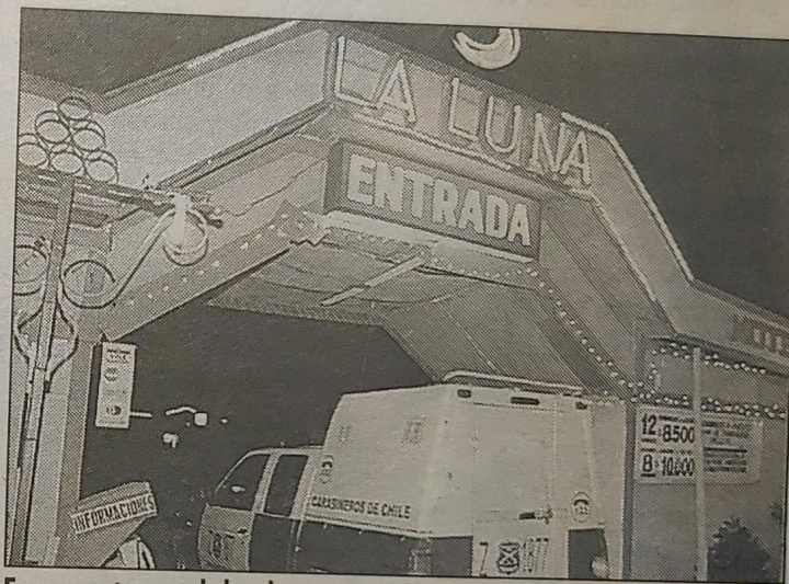
Fue en este motel donde encontró la muerte la joven pareja gay. Aún no se sabe con exactitud qué sucedió al interior del recinto.

El presidente de Movilh señaló que es de suma importancia que se deje muy bien establecido que si