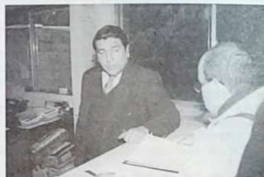
Movimiento homosexual entrega el informe “Movilh-Divine” en el Quinto Juzgado y demanda la reapertura del Caso además de la remoción del Juez Jorge Gándara

A juicio de Arellano uno de los aspectos que impide la comprobación de esa hipótesis se relaciona con el extraño desaparecimiento de una de las puertas de entrada, elemento clave para determinar si fue lanzada o no una bomba.