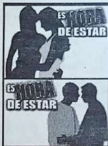
Campaña de los homosexuales peruanos para modificar la Constitución.

Las minorías peruanas sufren a diario violaciones a los derechos humanos que van desde el boicot contra su organización hasta agresiones físicas y verbales. Para combatir esas injusticias, los homosexuales crearon un frente de agrupaciones que busca modificar la Constitución en beneficio de sus intereses.