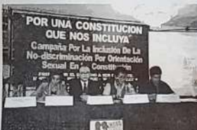
El Fredif, acompañado de organizaciones sociales, promueve en conferencia de prensa sus enmiendas a la Carta Magna.

La propuesta es parte de un intenso debate que se efectúa en Perú respecto a si debe reformarse la Constitución, eliminar la de 1993, dictada bajo el gobierno del destituido presidente Alberto Fujimori, o regresar a la Carta Magna de 1979.