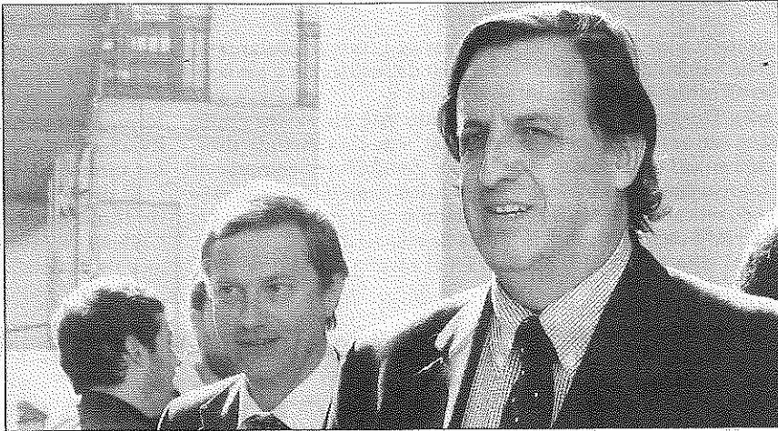
El senador Víctor Pérez transmitió críticas de la UDI sobre una falta de conducción política clara que permita aglutinar al sector tras una agenda post 21 de Mayo.