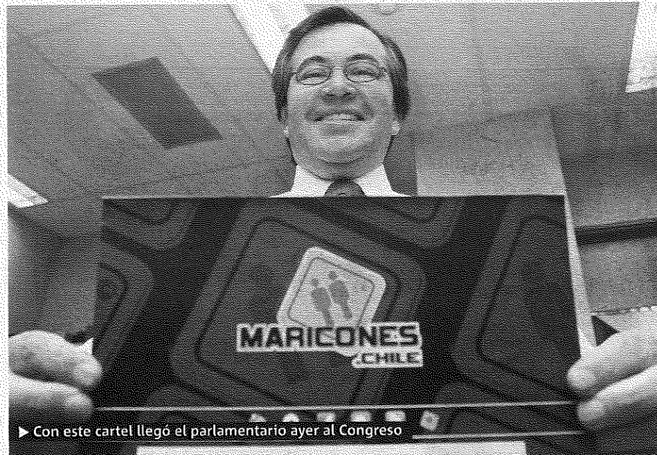
► Con este cartel llegó el parlamentario ayer al Congreso

El Movilh consideró como “histórico” que por primera vez un parlamentario deba rendir cuentas ante el Congreso “por denigrar a personas”, pero cuestionaron que el diputado no se haya excusado por “ofender y negar derechos a la diversidad sexual”. ● PUBLIMETRO