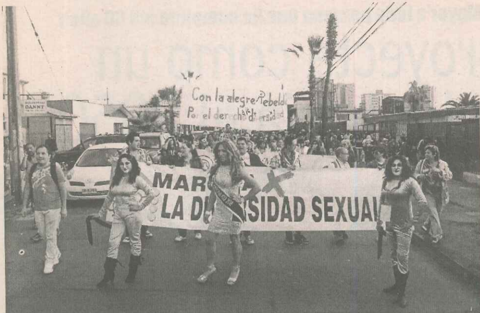
Por segundo año se desarrolla en Iquique la Marcha por la Diversidad Sexual, que organiza por Falange por la Diversidad Sexual, Fadise.