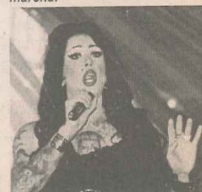
La marcha terminó con un show artístico en la Plaza Prat, donde se presentaron números artísticos.