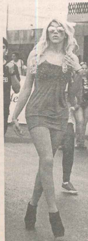
En la marcha de Fadise participaron representantes de todo el país.