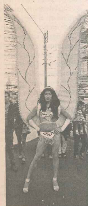
Según los organizadores de la Marcha por la Diversidad Sexual, el evento iquiqueño está convirtiéndose en uno de los más importantes del país, junto con el que se desarrolla en La Serena.