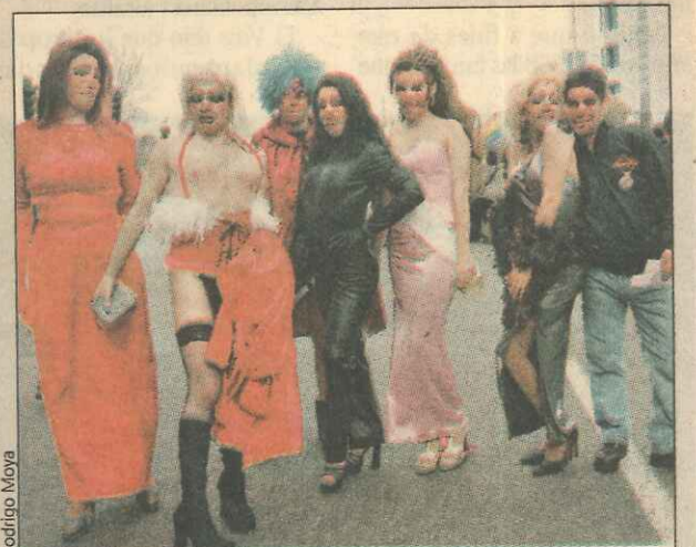
La actividad denominada "Patria Gay" se ha lucido con sus marchas en que transgéneros, transformistas y Drag-Queen que se han paseado por las principales calles de Santiago.