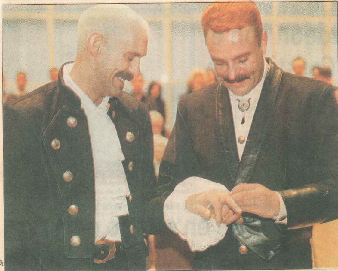
Los matrimonios gay en el mundo son una realidad. Dinamarca dio el primer paso en 1989 con la legalización de las uniones de hecho, situación que se consolidó el 12 de septiembre del 2000, cuando el Parlamento de Holanda les confirió la totalidad de derechos conyugales.