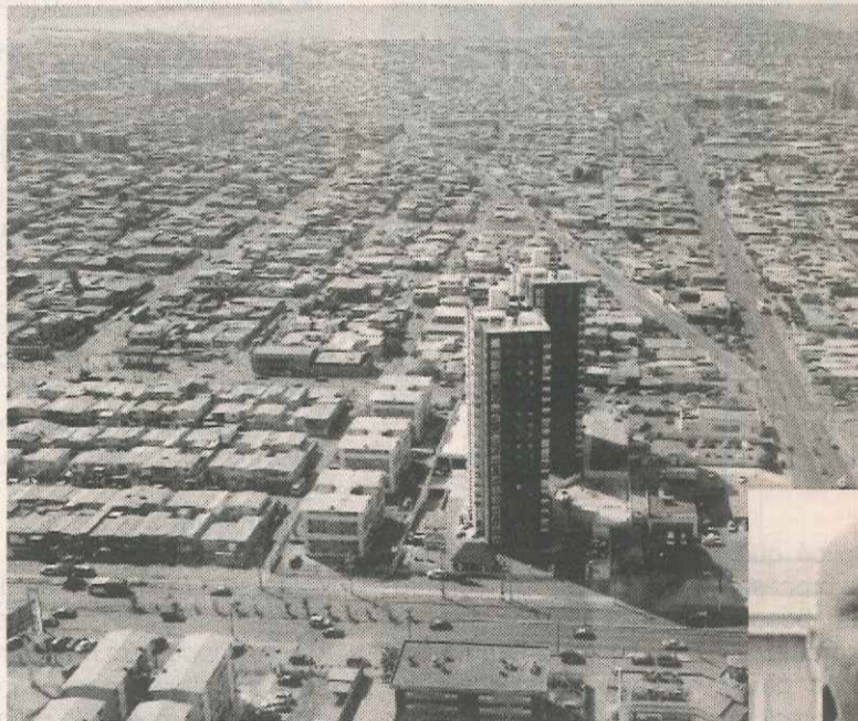
La muestra consideró 416 personas en cuatro puntos de la ciudad: centro, mall, mercado y Terminal Agropecuario.

Este es uno de los resultados que arrojó la encuesta "Diversidad sexual y estructura familiar homoparental: Percepciones, inquietudes y creencias en torno a la homosexualidad, unión matrimonial y derecho de adopción en parejas del mismo sexo" efectuado por el Núcleo de Estudios Sociales y Opinión Pública, Nesop, de la Universidad de Tarapacá.