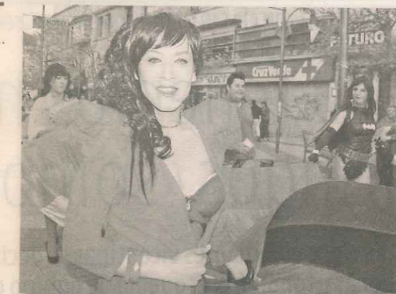
La Marcha por el Orgullo Gay finalizó con una fiesta en el Paseo Arauco.

que se presentó justo cuando el matrimonio de la Catedral finalizaba. El plato fuerte de la noche fue el grupo nacional "Sexual Democracia", que tocó sus característicos temas hasta la medianoche.