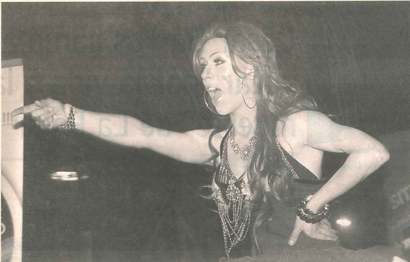
Transformistas locales se encargaron de animar el show artístico del orgullo gay realizado ayer.