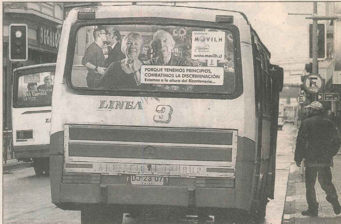
Los microbuses pertenecientes a la Línea 3 llevan en sus ventanales traseros los afiches de la campaña.

La iniciativa es pionera a nivel país, ya que incluso la empresa del Transantiago rechazó la posibilidad de implementarla.