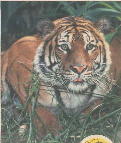
► Tiburones blancos, osos polares y tigres están más cerca de la extinción