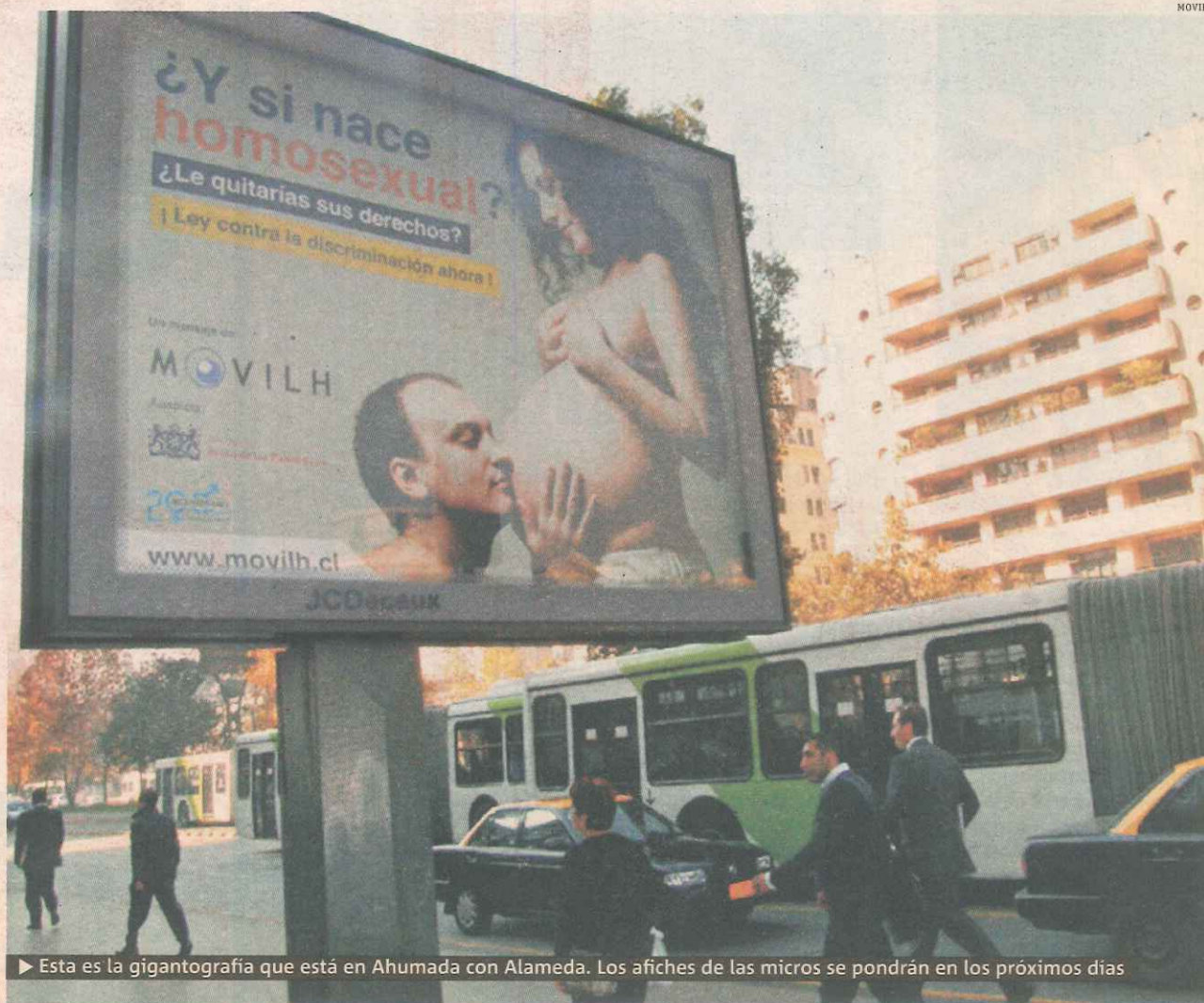
► Esta es la gigantografía que está en Ahumada con Alameda. Los afiches de las micros se pondrán en los próximos días