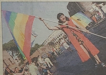
Chile tendrá su primera "Gay Parade".

cia, contará con seguridad privada y de personal de Carabineros. La idea es evitar presuntos ataques de grupos neonazis.