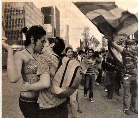
La unión civil sería usada también por parejas heterosexuales.